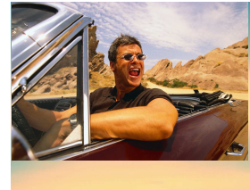
・料金未払いによるロス対策