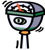
・駐車場機材の破壊対策