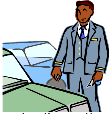
・車上荒らし対策

防犯システム構築による抑止力とセキュリティの強化 カメラによるマネジメントへの活用